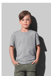
ST2220 Classic-T Organic